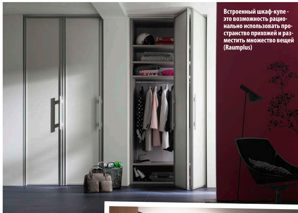
Встроенный шкаф-купе - это возможность рационально использовать пространство прихожей и разместить множество вещей (Raumplus)