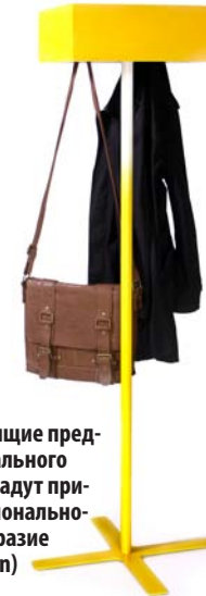
Отдельно стоящие предметы оригинального дизайна придадут прихожей функциональность и своеобразие (Vaughshannon)