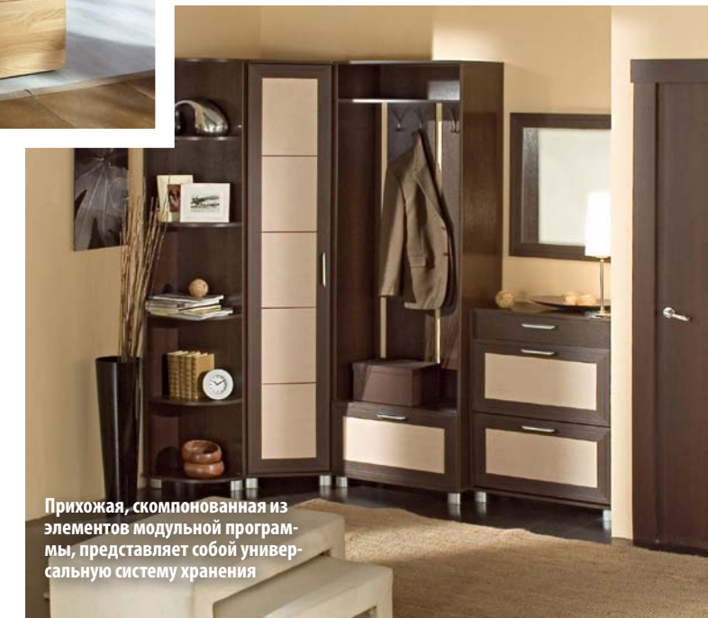
Прихожая, скомпонованная из элементов модульной программы, представляет собой универсальную систему хранения