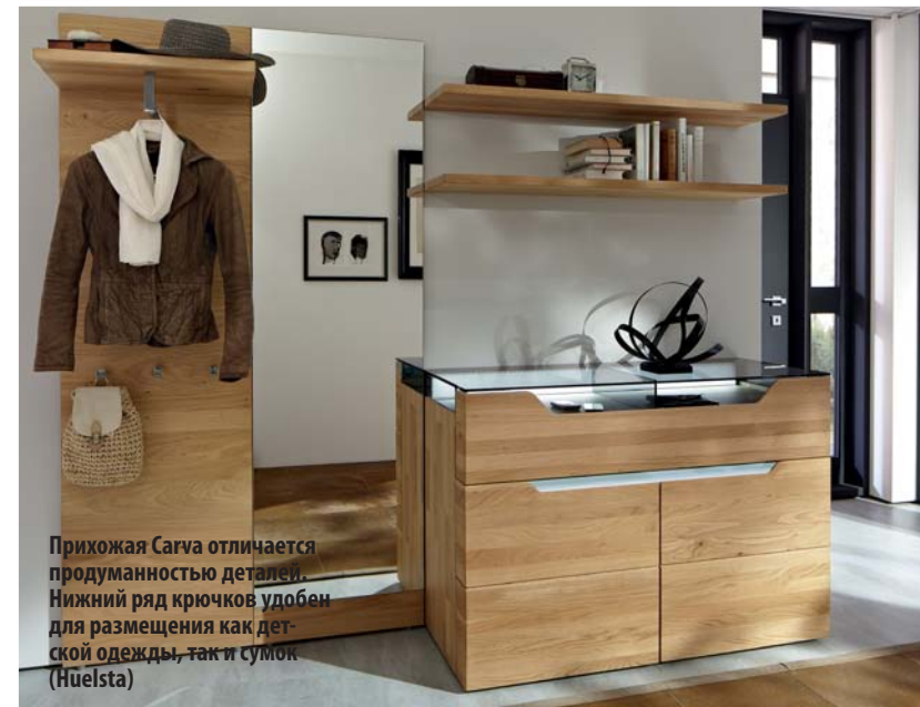
Прихожая Garva отличается продуманностью деталей. Нижний ряд крючков удобен для размещения как детской одежды, так и сумок (Huelsta)

нальным решением может стать зеркало, совмещенное с тумбой. Но оно отразит вас лишь по пояс. Каким бы ни было зеркало, располагать его нужно ближе к двери такими образом, чтобы оставался свободный подход.