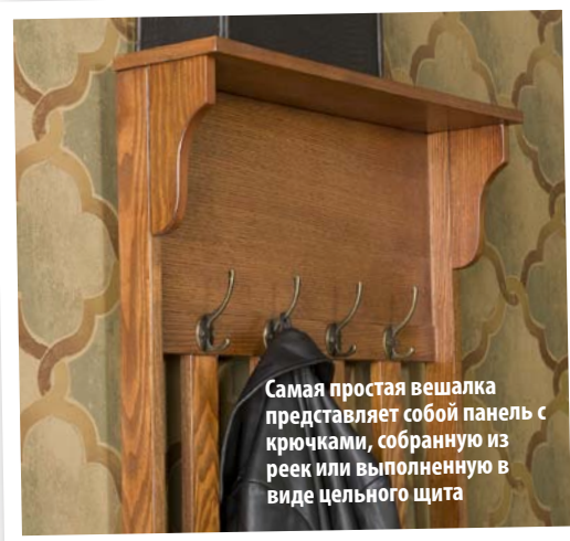
Самая простая вешалка представляет собой панель с крючками, собранную из реек или выполненную в виде цельного щита