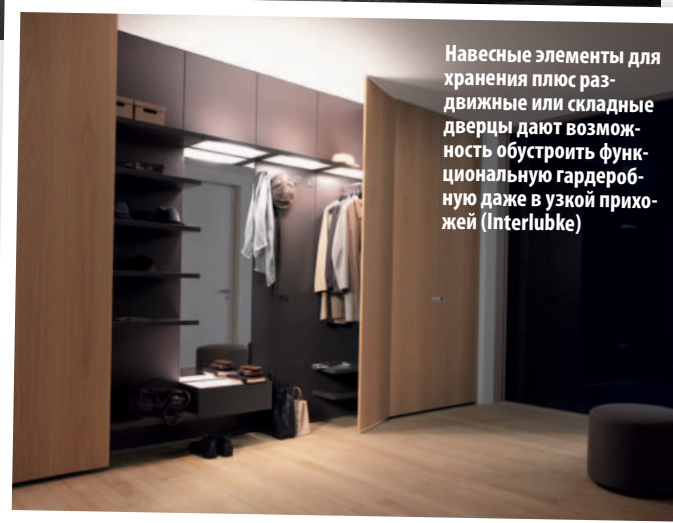
Навесные элементы для хранения плюс раздвижные или складные дверцы дают возможность обустроить функциональную гардеробную даже в узкой прихожей (Interlubke)