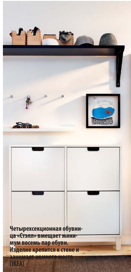
Четырехсекционная обувница «Стэлл» вмещает минимум восемь пар обуви. Изделие крепится к стене и занимает немного места (IKEA)

Если в семье есть дети, следует позаботиться о размещении крючков для одежды в два ряда — нижний на высоте 80-120 см