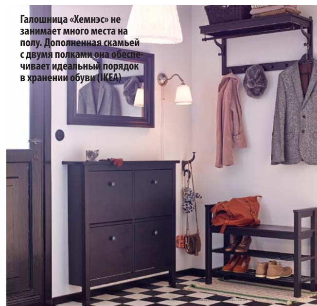
Галошница «Хемнэ» не занимает много места на полу. Дополненная скамейкой с двумя полками она обеспечивает идеальный порядок в хранении обуви (IKEA)

* Вешалка. Самый простой настенный вариант вешалки представляет собой панель с крючками и полкой для головных уборов. Наиболее удобны вешалки, дополненные торцевым вешалом, опирающимся на металлическую стойку. В этом случае одежду можно повесить не только на крючки, но и на плечики. Напольные модели обычно выглядят как стойки с «рожками» для одежды. Часто они имеют оригинальный дизайн, но при покупке их следует проверять на устойчивость. Вообще, выбирая вешалку, нужно сразу решить, какое количество вещей вы будете на ней держать. Множество висящей на крючках одежды смотрится не вполне эстетично, но и совсем пренебрегать открытым хранением не стоит. * Обувница. Представлена двумя основными типами мебели для хранения обуви: галошницей — низкой подставкой с одной-двумя открытыми полочками, и обувницей-слим — неглубоким шкафчиком, в котором обувь размещается на внутренней стороне откидывающихся дверец, в отделениях-карманах. Обувница-слим может вместить в себя до двух десятков пар любой обуви, кроме сапог. Галошница предназначена для временного хранения, просушки и проветривания