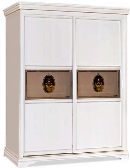
Прочность и долговечность шкафу-купе для одежды «Влада» придает его основа — массив и шпон бука. Объем внутреннего пространства достаточен для самого внушительного гардероба (БЕЛФАН)