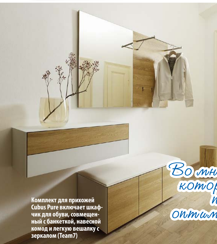
Комплект для прихожей Sibus Pure включает шкафчик для обуви, совмещенный с банкеткой, навесной комод и легкую вешалку с зеркалом (Team7)

Во многих салонах есть дизайнеры, которые с помощью программы-планировщика подберет оптимальный вариант мебелировки для вашей прихожей