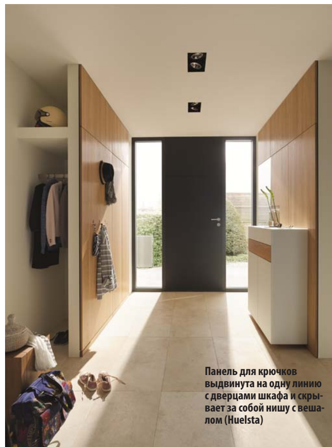
Панель для крючков выдвинута на одну линию с дверцами шкафа и скрывает за собой нишу с вешалом (Huelsta)