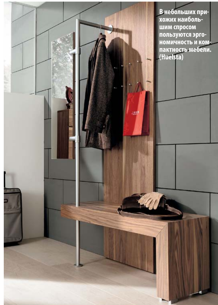
В небольших прихожих наибольшим спросом пользуются эргономичность и компактность мебели. (Huelsta)