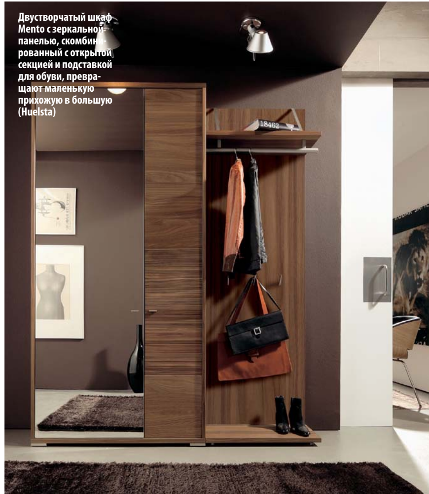
Двухстворчатый шкаф Mento с зеркальной панелью, скомбинированный с открытой секцией и подставкой для обуви, превращают маленькую прихожую в большую (Huelsta)