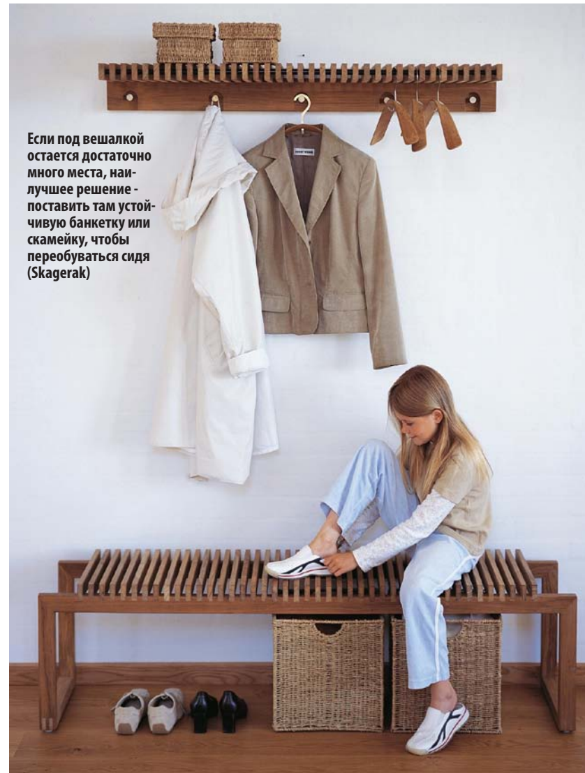
Если под вешалкой остается достаточно много места, наилучшее решение - поставить там устойчивую банкетку или скамейку, чтобы переобуваться сидя (Skagerak)

Штучный вариант Если подходящих комплектов не нашлось, всегда можно попробовать обставить прихожую отдельными элементами. Это увлекательное, но непростое занятие — ведь учитывать придется не только размеры, но также материал изготовления и отделки каждого предмета.