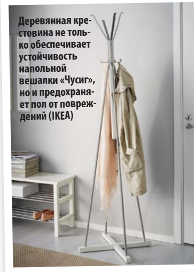
Деревянная крестовина не только обеспечивает устойчивость напольной вешалки «Чусиг», но и предохраняет пол от повреждений (IKEA)

* Зеркало. Минимальный размер зеркала должен быть таким, чтобы в глядя в него можно было надеть головной убор и поправить шарф. С этой задачей справится зеркало высотой 400 мм. Но если вы хотите перед выходом из дома видеть свое отражение в полный рост, выбирайте зеркало высотой не менее 1400 мм. Для небольшой прихожей рациональным решением может стать зеркало, совмещенное с тумбой. Но оно отразит вас лишь по пояс. Каким бы ни было зеркало, располагать его нужно ближе к двери такими образом, чтобы оставался свободный подход.