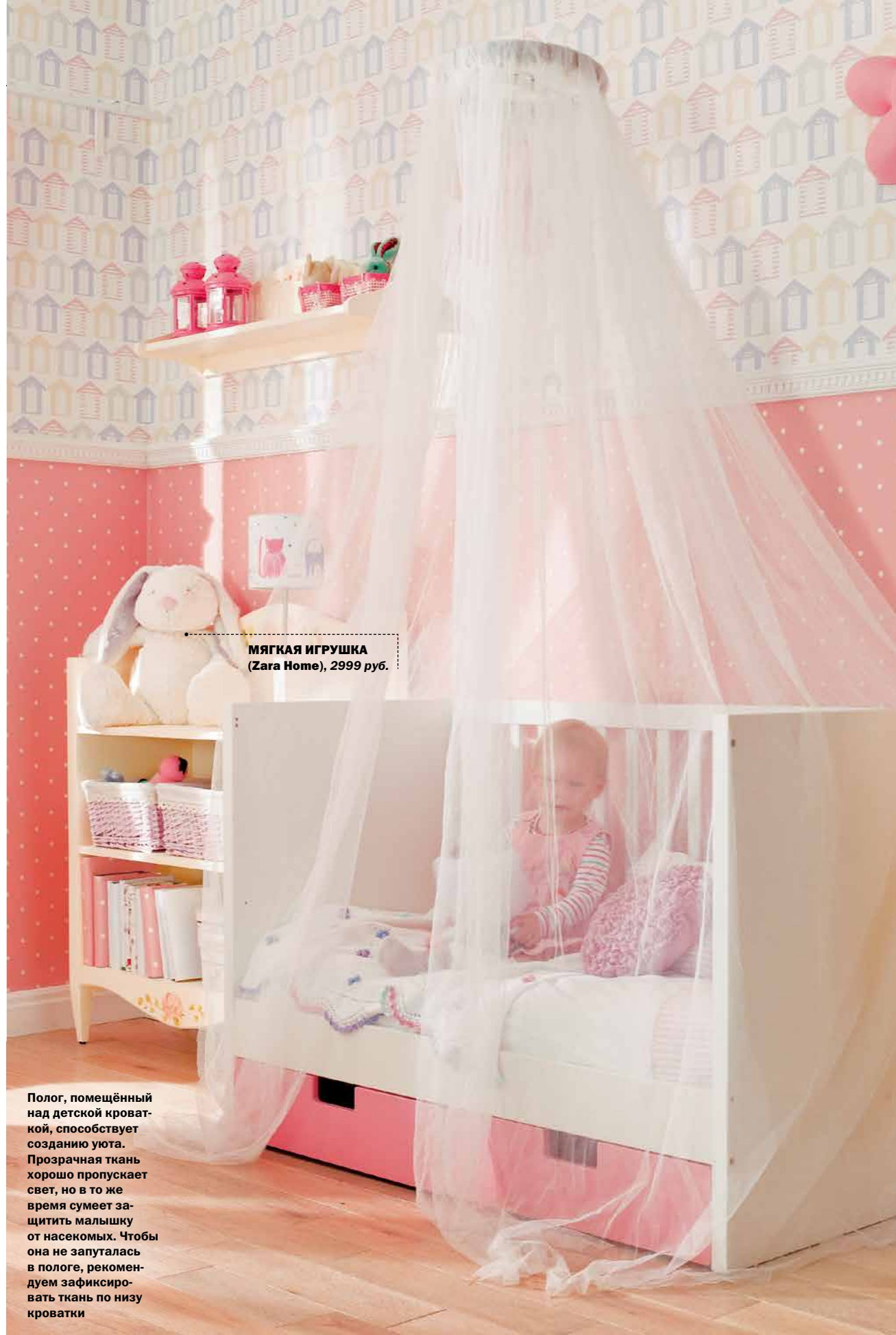
МЯГКАЯ ИГРУШКА (Zara Home), 2999 руб.

Полот, помещённый над детской кроваткой, способствует созданию уюта. Прозрачная ткань хорошо пропускает свет, но в то же время сумеет защитить малышку от насекомых. Чтобы она не запуталась в пологе, рекомендуем зафиксировать ткань по низу кроватки