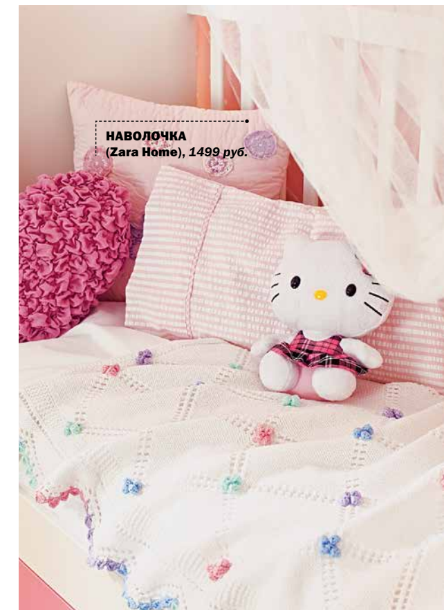
НАВОЛОЧКА (Zara Home), 1499 руб.