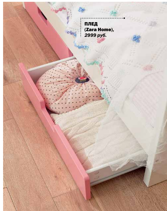
ПЛЕД (Zara Home), 2999 руб.

Очень удобно, если конструкция кроватки предполагает «дополнения» в виде выкатных ящиков. Тогда вопрос, где хранить постельное бельё, одеяла и подушки, можно считать закрытым Даже самые простые детские кроватки «умеют» расти вместе с ребёнком: их основание опускается, а одна из боковинки снимается