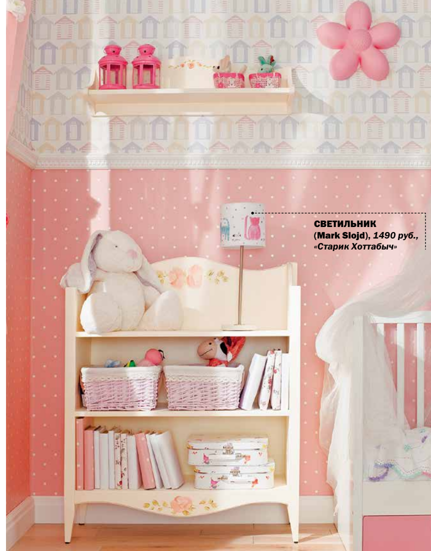
СВЕТИЛЬНИК (Mark Slojd), 1490 руб., «Старик Хоттабыч»

Полот, помещённый над детской кроваткой, способствует созданию уюта. Прозрачная ткань хорошо пропускает свет, но в то же время сумеет защитить малышку от насекомых. Чтобы она не запуталась в пологе, рекомендуем зафиксировать ткань по низу кроватки