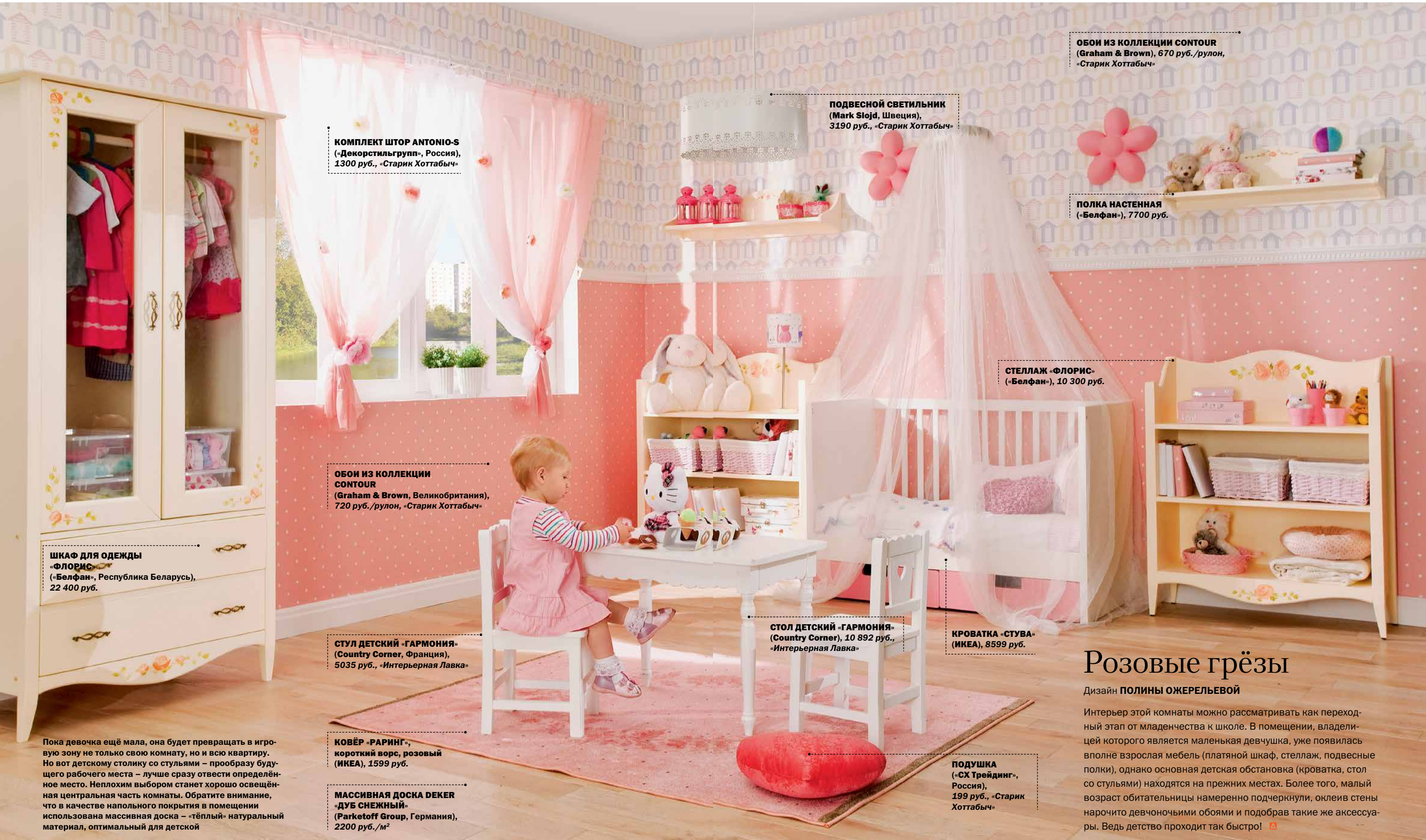
КОМПЛЕКТ ШТОР ANTONIO-S («Декорстильгрупп», Россия), 1300 руб., «Старик Хоттабыч»