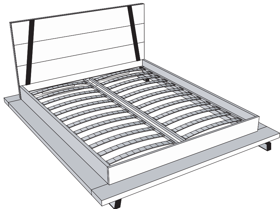
СХЕМА СБОРКИ Кровать "Dillinger" 140