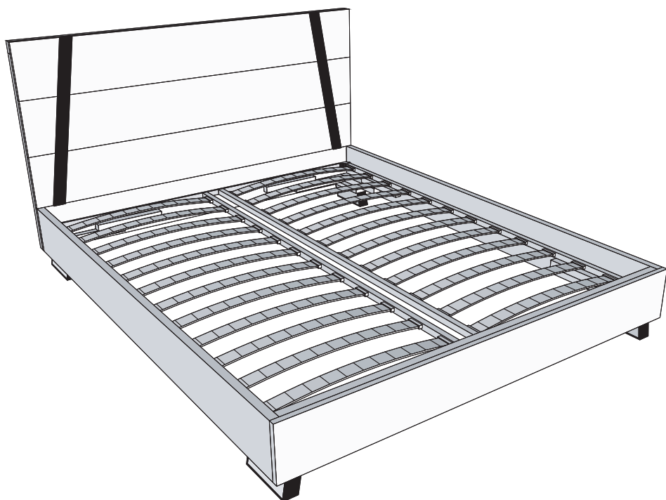
СХЕМА СБОРКИ Кровать "Dillinger" 140У